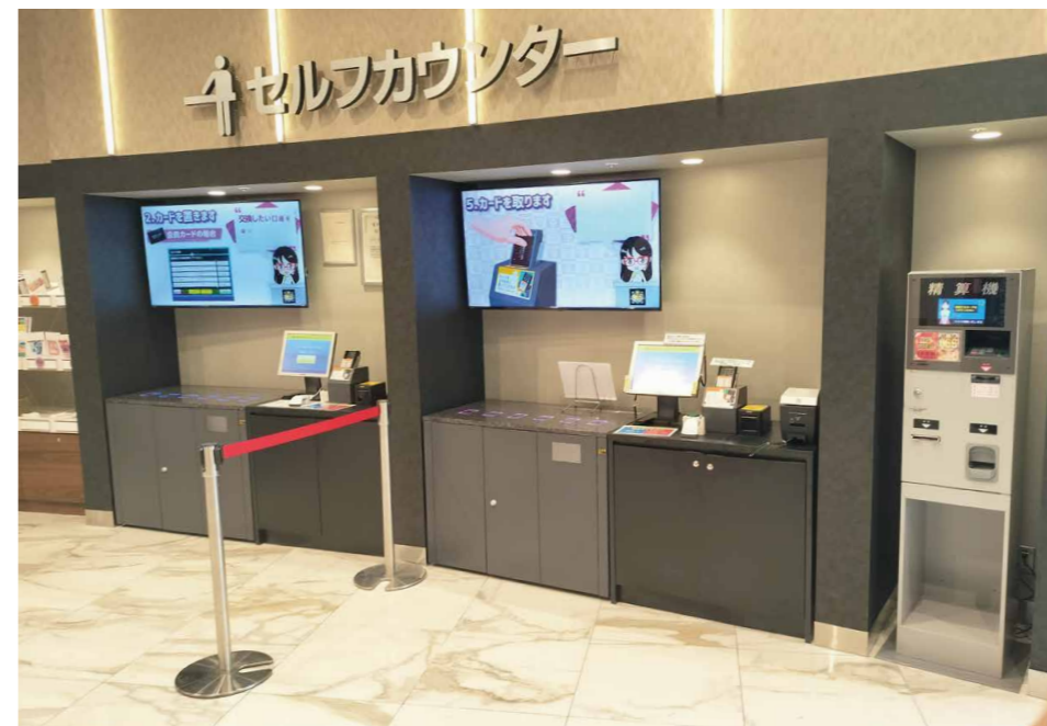
全国的に導入が進む「セルフ交換POS」。会員限定のサービスとして運用するホールも多い。写真は(M's666菊水店)(札幌市白石区)の導入風景。

遊技客とスタッフの負担を減らす、ホール営業に欠かせない製品群 三種の神器 で営業をスマート化 ファンに喜ばれる店舗づくりには、スタッフ・遊技客双方が負担なく快適に業務・遊技ができる環境が欠かせない。そしてそれは(株)マースエンジニアリングが最も得意とする部分だ。具体的な製品・システムを紹介する。