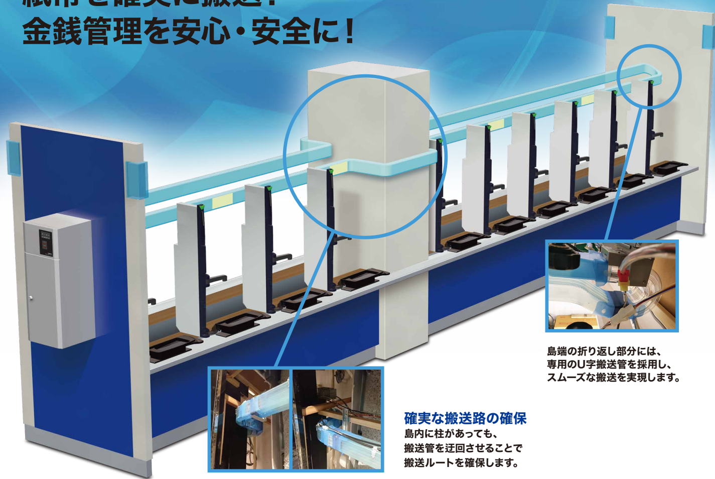
島端の折り返し部分には、専用のU字搬送管を採用し、スムーズな搬送を実現します。